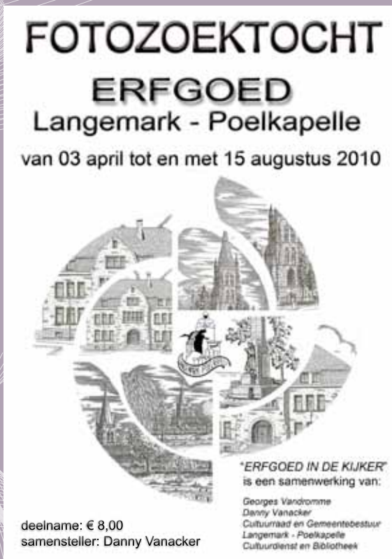
Affiche Ria Vermeersch